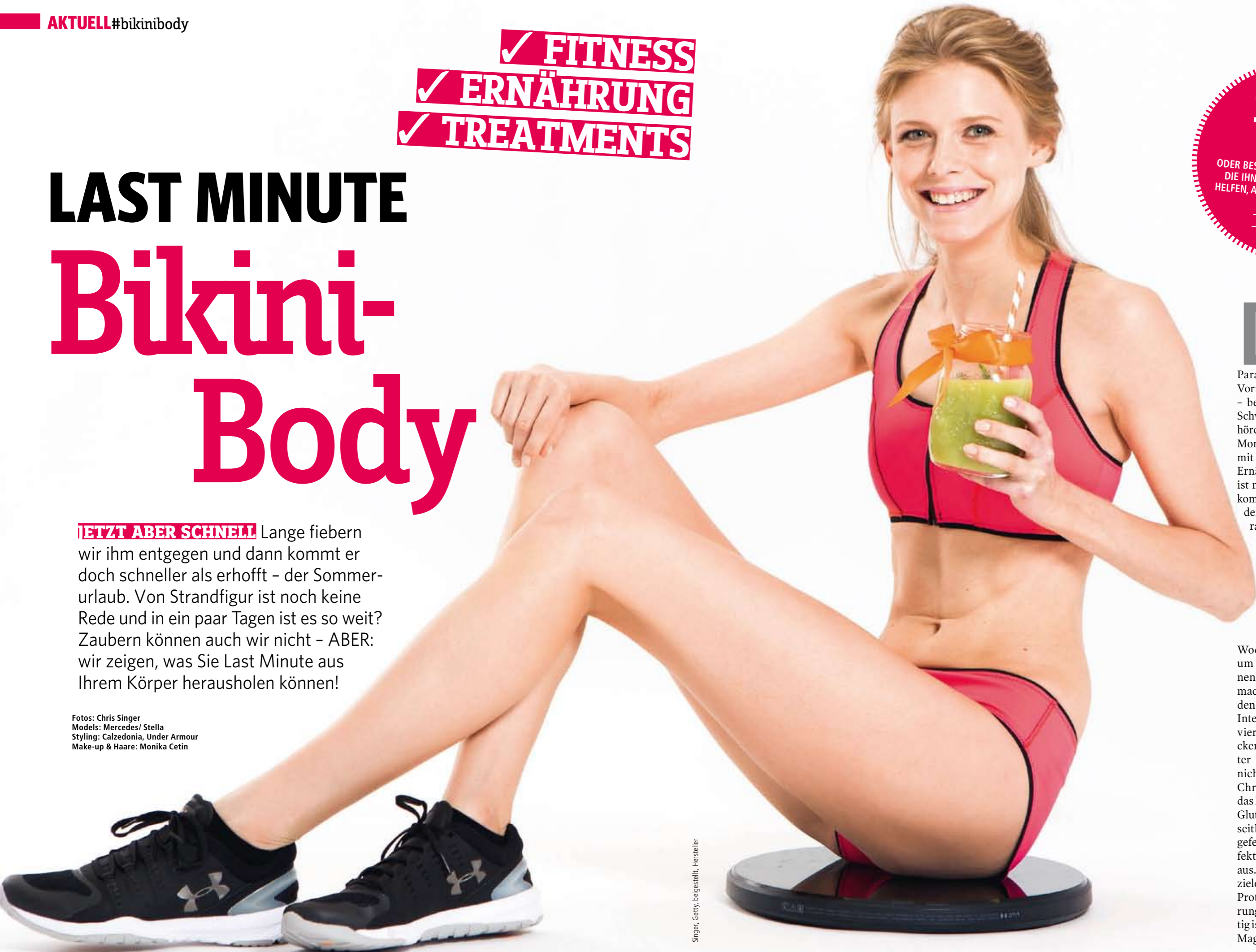
Singer, Getty, beigestellt, Hersteller

Fotos: Chris Singer Models: Mercedes/ Stella Styling: Calzedonia, Under Armour Make-up & Haare: Monika Cetin